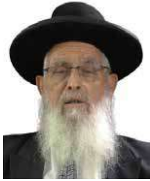
מו"ר הגאון הרב יעקב אריאל שליט"א